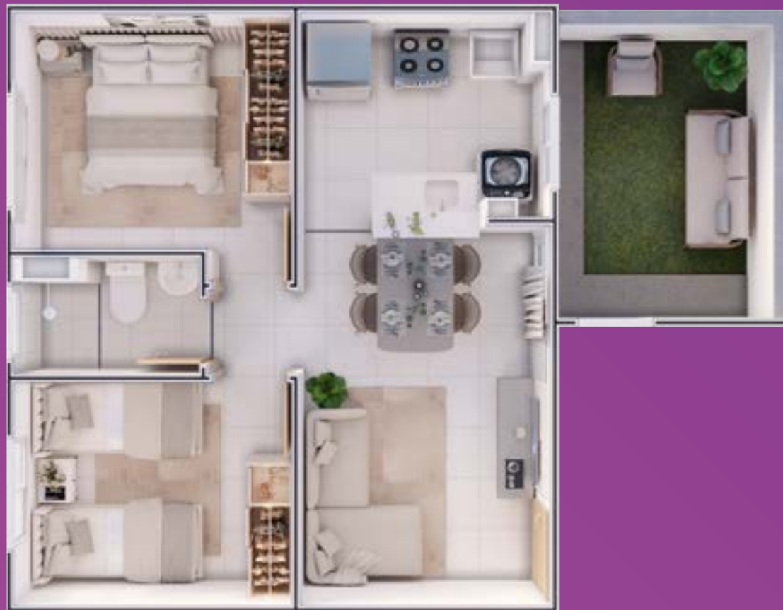
APARTAMENTO COM ÁREA PRIVATIVA