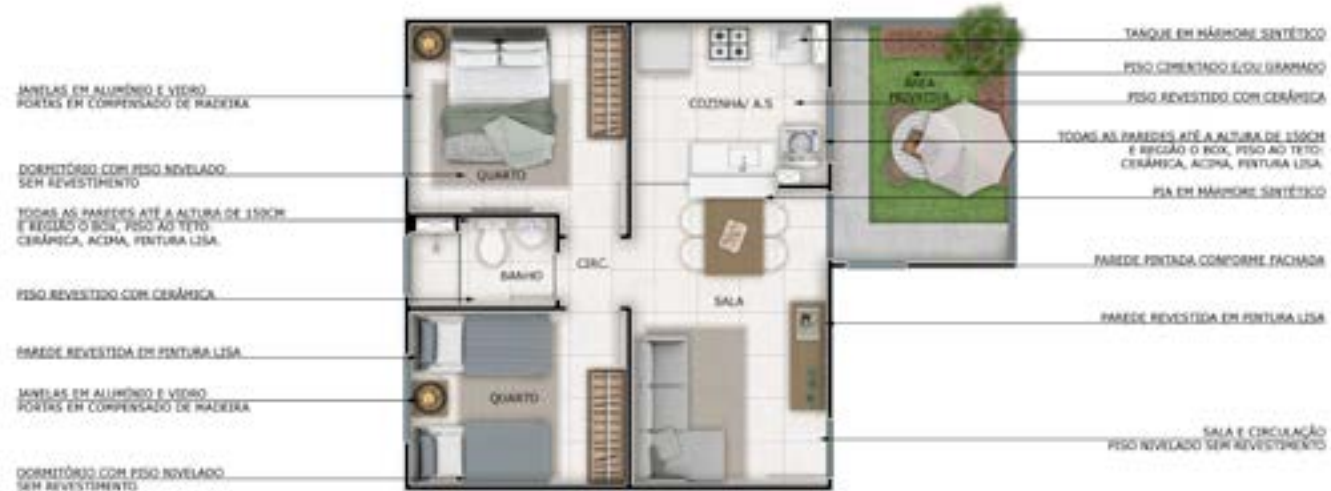
Ref.: Apartamento 101 | Bloco 1