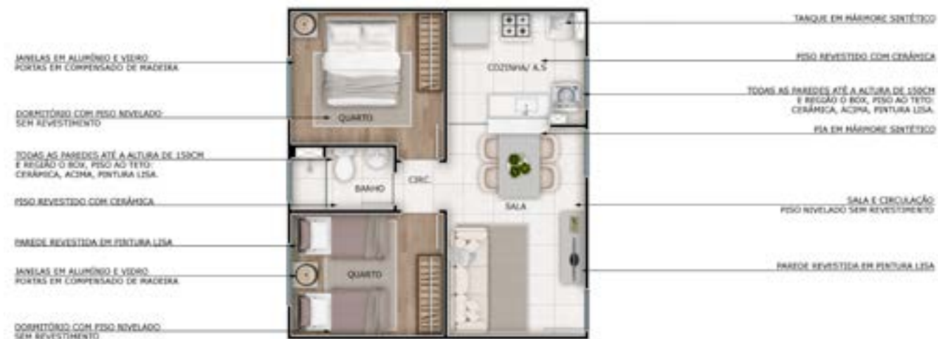
Ref.: Apartamento 201 | Bloco 1